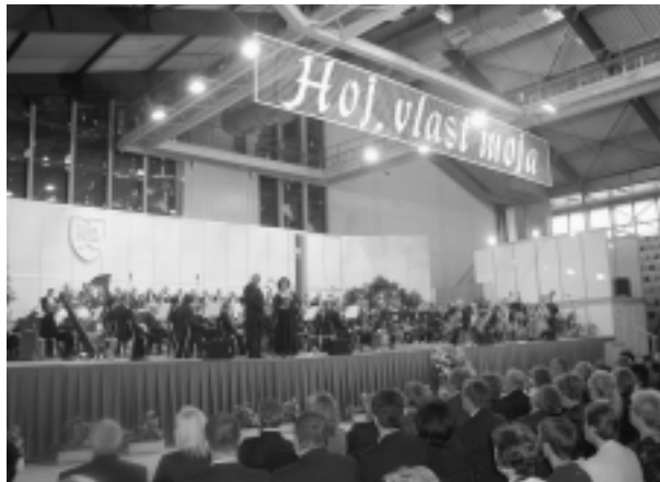
Koncert je už niekoľko rokov lákavý obsadením a vynikajúcimi výkonmi najvýznamnejších sólistov orchestra Zboru opery SND.