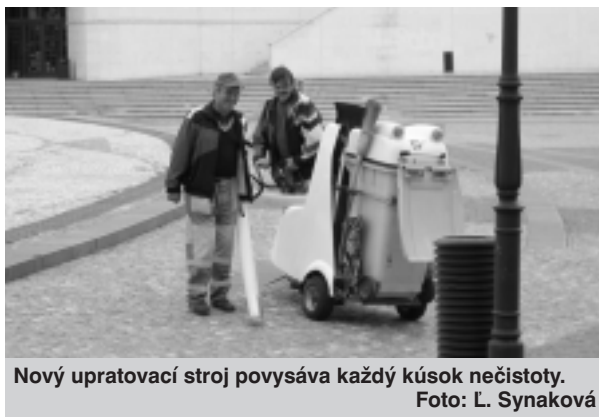
Nový upratovací stroj povysáva každý kúsok nečistoty.

V týchto dňoch v meste štaruje pravidelné jesenné upratovanie, ktoré je zamerané na odvoz klasického komunálneho odpadu. Zostáva nám veriť, že spoločnými silami obyvateľov „vychováme“ k pozitívnemu vzťahu k životnému prostrediu a že Nitra bude čistým mestom, ktoré bude vzorom pre ďalšie slovenské mestá.