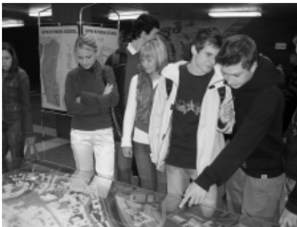
Študenti sa zaujímali o budúcu podobu mesta pod Zoborom. Maketa znázorňovala aj plánovanú výstavbu.

Dopoludnia sa vedenie mesta stretlo v zasadačke úradu so študentmi stredných škôl, kde im prostredníctvom krátkej prednášky vysvetlili fungovanie samosprávy. Študenti položili mnoho zvedavých otázok, no oveľa živšie sa ukázalo byť stretnutie primátora a vedenia mesta s občanmi v popoludňajších hodinách. Do zasadačky mestského úradu