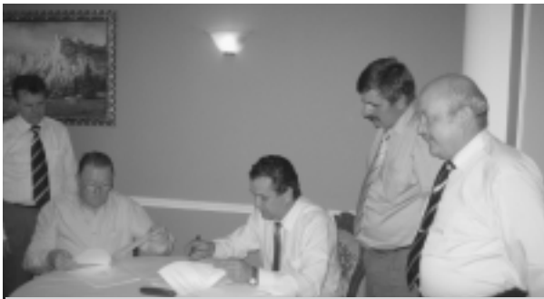
Vedenia oboch miest pri znovupodpisovaní zmluvy o partnerskej spolupráci.