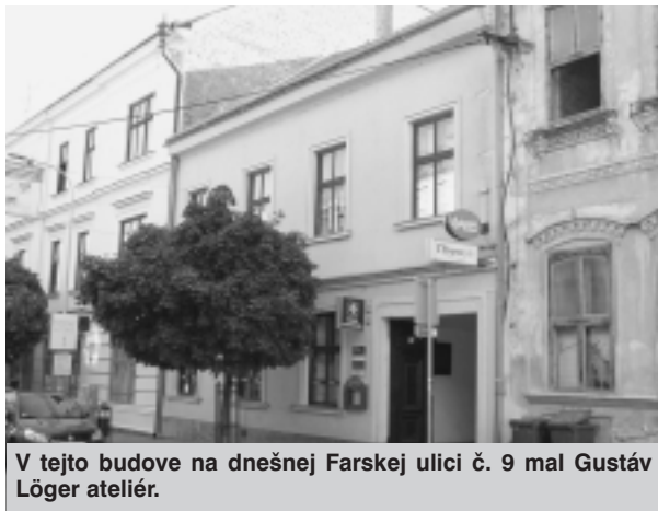
V tejto budove na dnešnej Farskej ulici č. 9 mal Gustáv Löger ateliér.